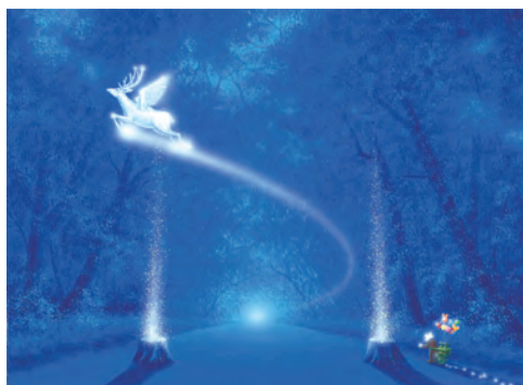
「東日本大震災からの復興再生を語り継ぐ鹿島神宮物語」3部作

この度、平成27年に、東日本大震災からの鹿島神宮の復興再生祭事を描いたご奉納3作品と、日本人の心のふるさと伊勢神宮を描いた作品の朗読公演を開催いたします。